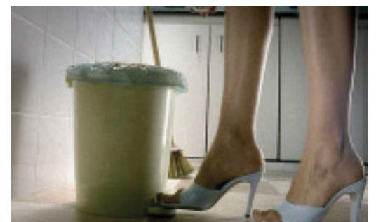
Fotograma del comercial de TV "Funciona"

Para lograr este objetivo, Nextel Argentina monitorea permanentemente sus necesidades, mante-